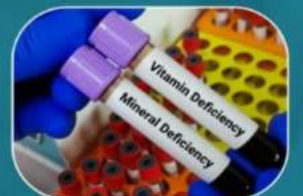
Vitamin & Nutrient Test

ਆਪਣੇ ਹੋਣ ਵਾਲੇ Baby ਦਾ Gender ਜਾਣੇ 6 Weeks ਵਿੱਚ