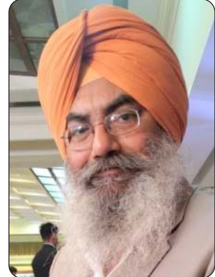
ਕੋਜਰੀਵਾਲ ਵਾਪਸ ਜੇਲੂ ਚਲਾ ਗਿਆ ਹੈ ਅਤੇ ਚੋਣ ਨਤੀਜਿਆਂ ਤੋਂ ਬਾਅਦ ਆਮ ਆਦਮੀ ਪਾਰਟੀ ਦੀ ਹੱਦ ਵੀ ਖਤਮ ਹੋ ਜਾਵੇਗੀ।